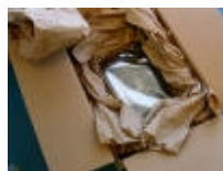
Hårddisk packad i kartong med papper

Att packa i specialemballage med formgjuten plast eller skumgummi är inte möjligt för de flesta eftersom sådant emballage inte är lättillgängligt. Huvudsaken är att följa principen, att du försöker fixera hårddisken i centrum av lådan med hjälp av kartongbitar, papper etc. Du kan t.ex. använda en mindre innerkartong som du lägger den i. Varför så krångligt? Hårddisken är känslig och det är dina data som ska räddas. Om mer än en hårddisk ska packas i samma kartong är ett bra alternativ att använda flera innerkartonger.