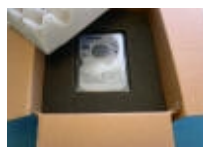
Hårddisk packad i kartong med formgjutet skumgummi. Idealiskt men inte så lättillgängligt.

Hårddisken måste ligga i en antistatpåse (ESD-skyddspåse). Den bör packas i en kartong med ca 5-10 cm dämpmaterial runt diskens alla sidor. Hårddisken ska ligga stadigt och inte kunna röra sig i kartongen. Använd inte plastchips utan hellre papper eller bubbelplast. Bäst är skumgummi. Packa så att den centreras i mitten av kartongen på ett liknande sätt som det formgjutna skumgummit på bilden.