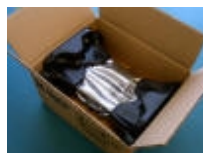
Hårddisk packad i kartong med formgjuten plast