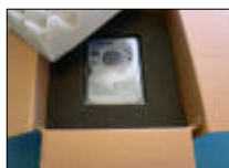
Hårddisk packad i kartong med formgjutet skumgummi. Idealiskt men inte så lättillgängligt.

Hårddisken måste ligga i en antistatpåse (ESD-skyddspåse). Den bör packas i en kartong med ca 5-10 cm dämpmaterial runt diskens alla sidor. Hårddisken ska ligga stadigt och inte kunna röra sig i kartongen. Använd inte plastchips utan hellre papper eller bubbelplast. Bäst är skumgummi. Packa så att den centreras i mitten av kartongen på ett liknande sätt som det formgjutna skumgummit på bilden.