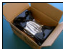
Hårddisk packad i kartong med formgjuten plast