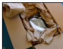
Hårddisk packad i kartong med papper

Att packa i specialemballage med formgjuten plast eller skumgummi är inte möjligt för de flesta eftersom sådant emballage inte är lättillgängligt. Huvudsaken är att följa principen, att du försöker fixera hårddisken i centrum av lådan med hjälp av kartongbitar, papper etc. Du kan t.ex. använda en mindre innerkartong som du lägger den i. Varför så krångligt? Hårddisken är känslig och det är dina data som ska räddas. Om mer än en hårddisk ska packas i samma kartong är ett bra alternativ att använda flera innerkartonger.